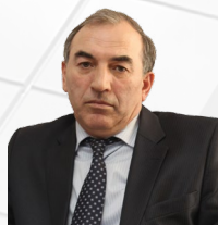
УПОЛНОМОЧЕННЫЙ Усманов Идрис Эмиевич

ДЕЙСТВУЕТ НА ОСНОВАНИИ Закона Чеченской Республики от 08.07.2013 № 25-РЗ «Об Уполномоченном по защите прав предпринимателей в Чеченской Республике»