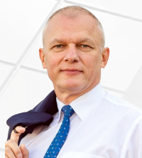
УПОЛНОМОЧЕННЫЙ Михайлов Юрий Владимирович

ДЕЙСТВУЕТ НА ОСНОВАНИИ Закона Новгородской области от 03.09.2013 № 321-03 «Об Уполномоченном по защите прав предпринимателей в Новгородской области»