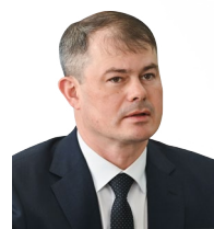
УПОЛНОМОЧЕННЫЙ Прасолов Александр Алексеевич

ДЕЙСТВУЕТ НА ОСНОВАНИИ Закона Удмуртской Республики от 07.10.2013 № 56-РЗ «Об Уполномоченном по защите прав предпринимателей в Удмуртской Республике»