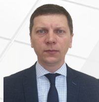
УПОЛНОМОЧЕННЫЙ Пастухов Вячеслав Анатольевич

ДЕЙСТВУЕТ НА ОСНОВАНИИ Закона Еврейской автономной области от 30.10.2013 № 392-ОЗ «Об Уполномоченном по защите прав предпринимателей в Еврейской автономной области»