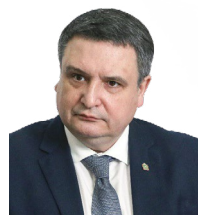
УПОЛНОМОЧЕННЫЙ Лисин Михаил Николаевич

ДЕЙСТВУЕТ НА ОСНОВАНИИ Закона Пензенской области от 29.08.2013 № 2420-ЗПО «Об Уполномоченном по защите прав предпринимателей в Пензенской области»