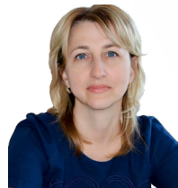
УПОЛНОМОЧЕННЫЙ Устинова Ольга Владиславовна

ДЕЙСТВУЕТ НА ОСНОВАНИИ Закона Волгоградской области от 10.07.2015 № 91-ОД «Об Уполномоченном по защите прав предпринимателей в Волгоградской области»