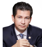
УПОЛНОМОЧЕННЫЙ Абдулганиев Фарид Султанович

ДЕЙСТВУЕТ НА ОСНОВАНИИ Закона Республики Татарстан от 05.07.2013 № 54-ЗРТ «Об Уполномоченном при Главе (Раисе) Республики Татарстан по защите прав предпринимателей»