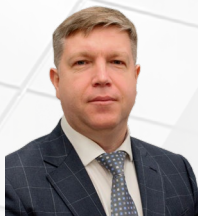
УПОЛНОМОЧЕННЫЙ Чуб Григорий Валерьевич

ДЕЙСТВУЕТ НА ОСНОВАНИИ Закона Магаданской области от 30.04.2014 №1748-03 «Об Уполномоченном по защите прав предпринимателей в Магаданской области»