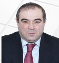
УПОЛНОМОЧЕННЫЙ Афасижев Юрий Сафарбиевич

ДЕЙСТВУЕТ НА ОСНОВАНИИ Закона Кабардино-Балкарской Республики от 17.04.2013 № 38-РЗ «Об Уполномоченном по защите прав предпринимателей в Кабардино- Балкарской Республике»