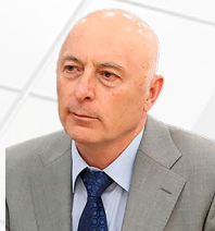
УПОЛНОМОЧЕННЫЙ Хаматханов Мурат Даутгиреевич

ДЕЙСТВУЕТ НА ОСНОВАНИИ Закона Республики Ингушетия от 03.12.2013 № 46-РЗ «Об Уполномоченном по защите прав предпринимателей в Республике Ингушетия»