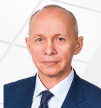
УПОЛНОМОЧЕННЫЙ Колпаков Андрей Николаевич

ДЕЙСТВУЕТ НА ОСНОВАНИИ Закона Калужской области от 01.07.2013 № 448 – ОЗ «Об Уполномоченном по защите прав предпринимателей в Калужской области»