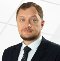
УПОЛНОМОЧЕННЫЙ Епанчинцев Владислав Викторович

ДЕЙСТВУЕТ НА ОСНОВАНИИ Закона Белгородской области от 04.03.2014 №260 «Об Уполномоченном по защите прав предпринимателей в Белгородской области»