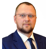
УПОЛНОМОЧЕННЫЙ Елизаров Вадим Викторович

ДЕЙСТВУЕТ НА ОСНОВАНИИ Закона ЯНАО от 22.04.2013 № 16-ЗАО «Об Уполномоченном по защите прав предпринимателей в ЯНАО»