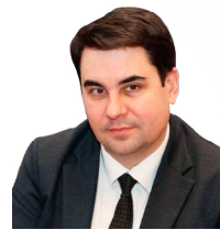
УПОЛНОМОЧЕННЫЙ Стамплевский Антон Владимирович

ДЕЙСТВУЕТ НА ОСНОВАНИИ Закона Тверской области от 17.07.2013 № 57-30 «Об Уполномоченном по защите прав предпринимателей в Тверской области»