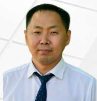
УПОЛНОМОЧЕННЫЙ Ооржак Ренат Чадамбаевич

ДЕЙСТВУЕТ НА ОСНОВАНИИ Закона Республики Тыва от 21.06.2014 № 2621 ВХ-1 «Об Уполномоченном по защите прав предпринимателей в Республике Тыва»