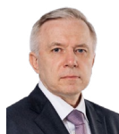
Шувалов Юрий Евгеньевич

РОССИЙСКИЙ ГОСУДАРСТВЕННЫЙ ДЕЯТЕЛЬ, ГОСУДАРСТВЕННЫЙ СОВЕТНИК ЮСТИЦИИ I КЛАССА, ПОЧЕТНЫЙ РАБОТНИК ПРОКУРАТУРЫ РОССИЙСКОЙ ФЕДЕРАЦИИ