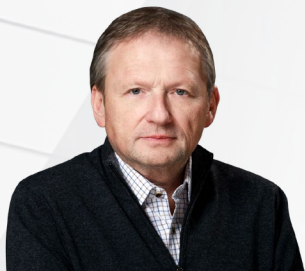
Б. Ю. Титов, Уполномоченный при Президенте РФ по защите прав предпринимателей

«Когда в нашу жизнь внезапно и резко вмешались непредвиденные факторы, стало особенно ясно, как важно для каждого жителя страны наличие отлаженной, четко работающей рыночной системы. Именно она позволяет быстро перенастраивать старые связи, не допускать дефицита критически важных товаров и услуг. К счастью, в новых условиях правительство пошло бизнесу навстречу, облегчив и продолжая облегчать условия работы. Пока еще далеко не все, чего мы желали, исполнено, но направление обнадеживающее.»