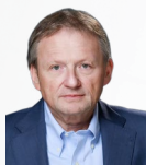
Титов Борис Юрьевич

УПОЛНОМОЧЕННЫЙ ПРИ ПРЕЗИДЕНТЕ РОССИЙСКОЙ ФЕДЕРАЦИИ ПО ЗАЩИТЕ ПРАВ ПРЕДПРИНИМАТЕЛЕЙ