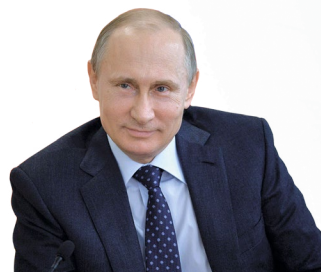
В. В. Путин, Президент Российской Федерации

в формировании и реализации государственной политики в области развития предпринимательской деятельности, улучшения делового климата.